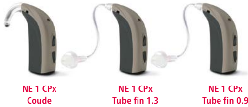
NE 1 CPx Coude