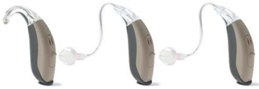
NE 1 N Coude